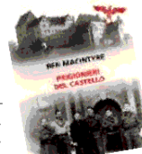
Ben Macintyre Prigionieri del castello Neri Pozza, 24 euro

• Protagonista il castello di Colditz in Sassonia. Dei numerosissimi tentativi di fuga pochi andarono a segno