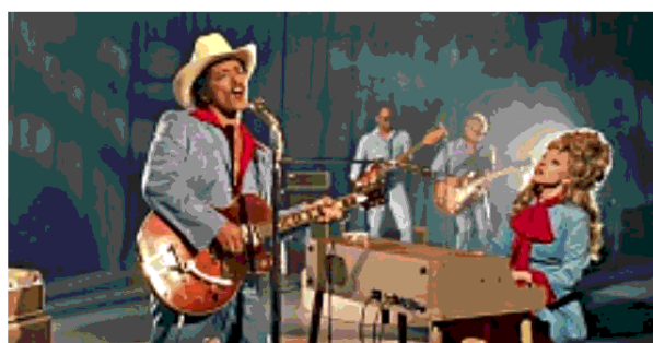
Bruno Mars e Lady Gaga nel video di Die With a Smile

Solo il 14% degli artisti supera i 10 uditori al mese