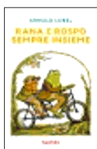
ARNOLD LOBEL RANA E ROSPO SEMPRE INSIEME (Babalibri) La storia che ha dato il via (nel 1970) alle avventure della coppia