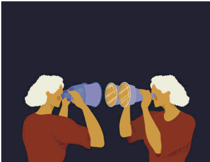
Sorveglianze affettive