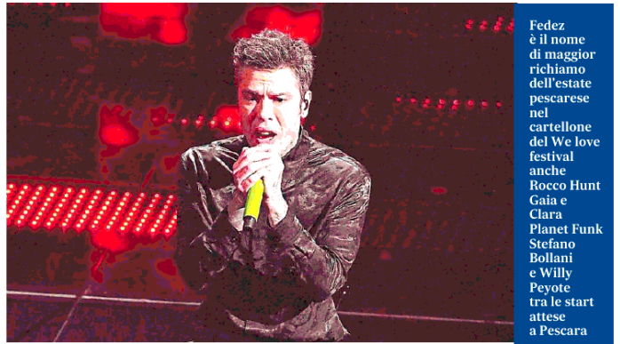
Fedez è il nome di maggior richiamo dell'estate pescarese nel cartellone del We love festival anche Rocco Hunt Gaia e Clara Planet Funk Stefano Bollani e Willy Peyote tra le start attese a Pescara