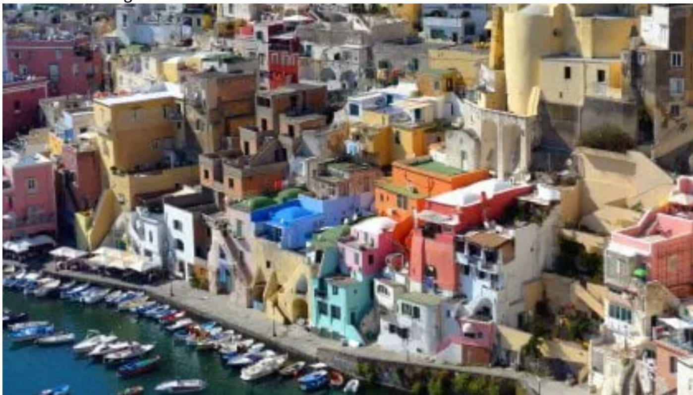
L'isola di Procida.