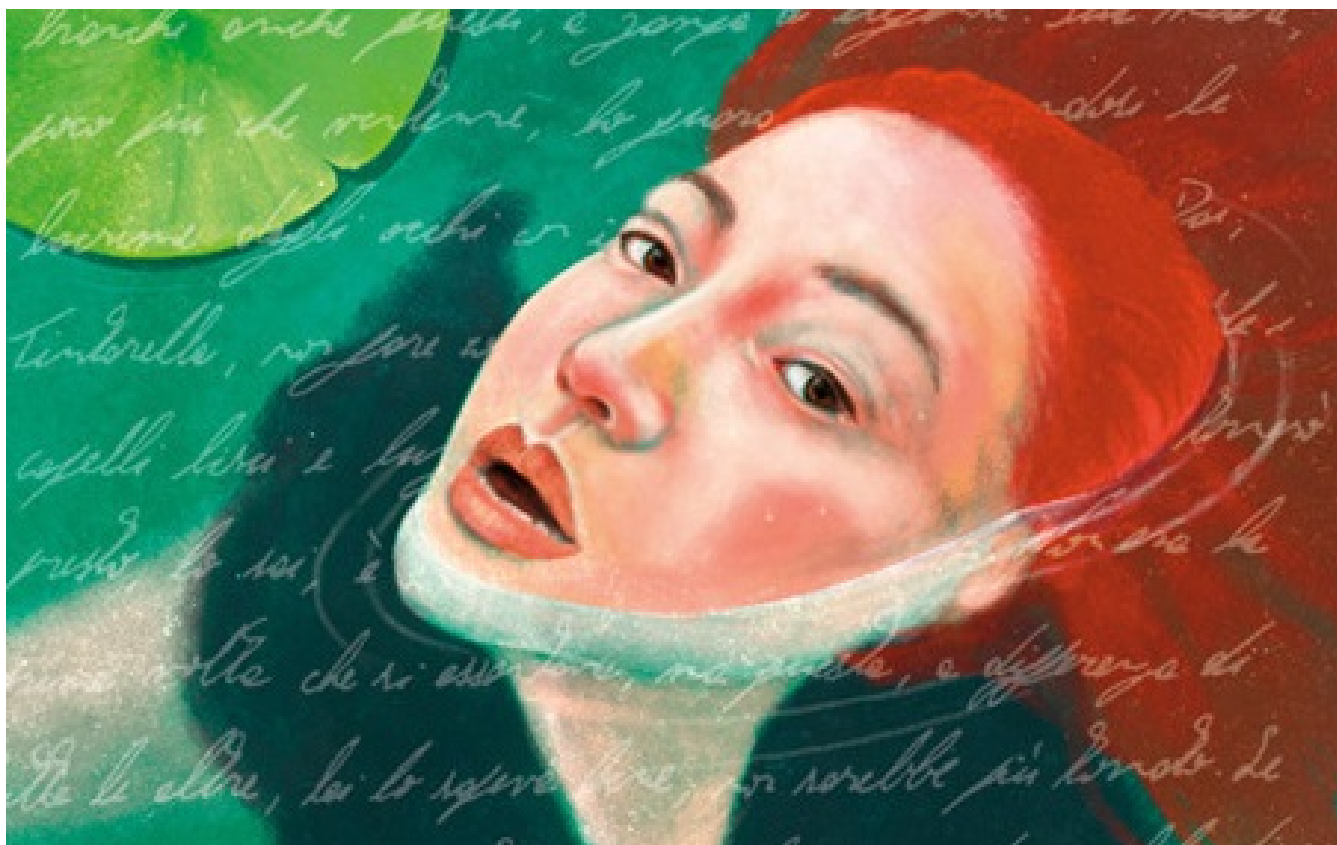
( https://www.toscanalibri.it/wp-content/uploads/2025/10/la-nuotatrice-notturna-dett.jpg )