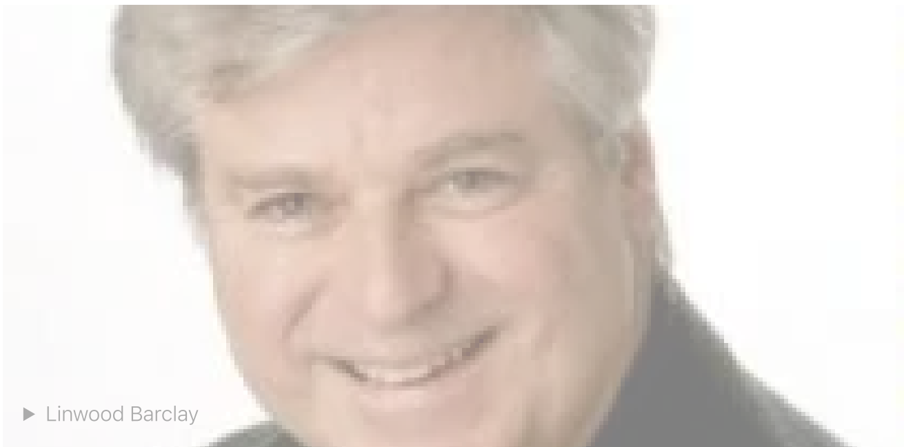
► Linwood Barclay

Barclay mantiene un ritmo costante, concludendo ogni capitolo con un aggancio che spinge il lettore a proseguire, tecnica tipica dei gialli dell'autore ma che qui diventa ancora più incisiva. La tensione si costruisce progressivamente fino a raggiungere un finale sorprendente. La narrazione alterna momenti di calma apparente a picchi di terrore puro, utilizzando una strategia di accumulo lento che permette all'angoscia di infiltrarsi sotto pelle. Barclay ci coccola per un po', proteggendoci dagli orrori a venire mantenendo Annie al centro della nostra attenzione. Il suo calore e la sua natura premurosa, la personalità arguta, lo spirito creativo sono la coperta rassicurante perfetta prima che il terrore lentamente si insinui.