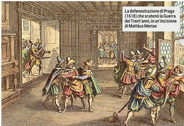
La defenestrazione di Praga (1618) che scatenò la Guerra dei Trent'anni, in un'incisione di Matthäus Merian

Quattrocento anni fa, la Guerra dei trent'anni che sconvolse l'intera Europa per dare