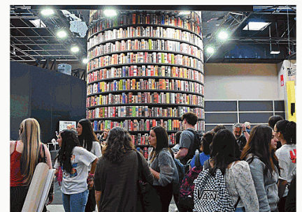
Inaugurata ieri la XXXVIII edizione del Salone del Libro a Torino